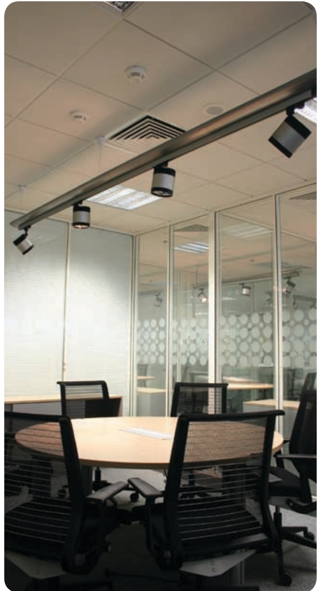
Офис компании British Petroleum (Москва)