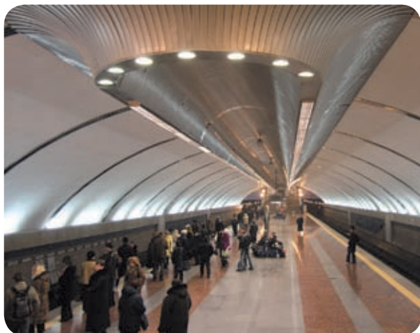
Станция метро «Бориспольская» (Киев)