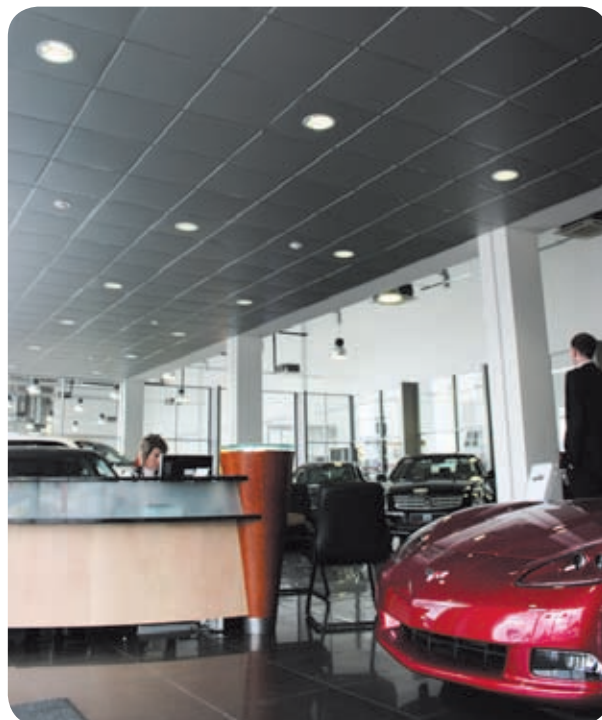
Автосалон «Лаура-Купчино» (Санкт-Петербург)