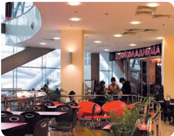
ТЦ «Европейский» (Москва)