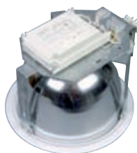
Светильник с ЭПРА.