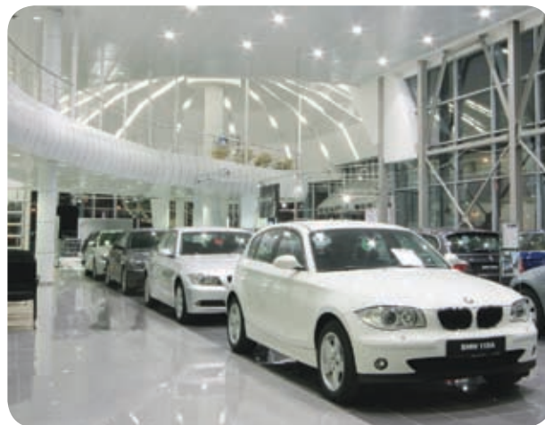
Салон BMW и Mini «Авиамоторс» (Санкт-Петербург)