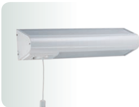
ВН 236 с кнопкой вызова (левосторонний).