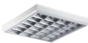
Светильник может комплектоваться решеткой из матового алюминия.