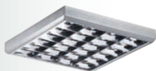
Цвет корпуса — металл.

Зеркальная параболическая решетка изготовлена из анодированного алюминия. Устанавливается в корпус скрытыми пружинами.