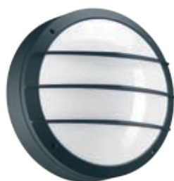
Цвет корпуса – черный.