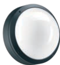
Цвет корпуса – черный.

компактная люминесцентная лампа — F ртутная лампа типа ДРЛ — M металлогалогенная лампа типа ДРИ — H натриевая лампа типа ДНаТ — S