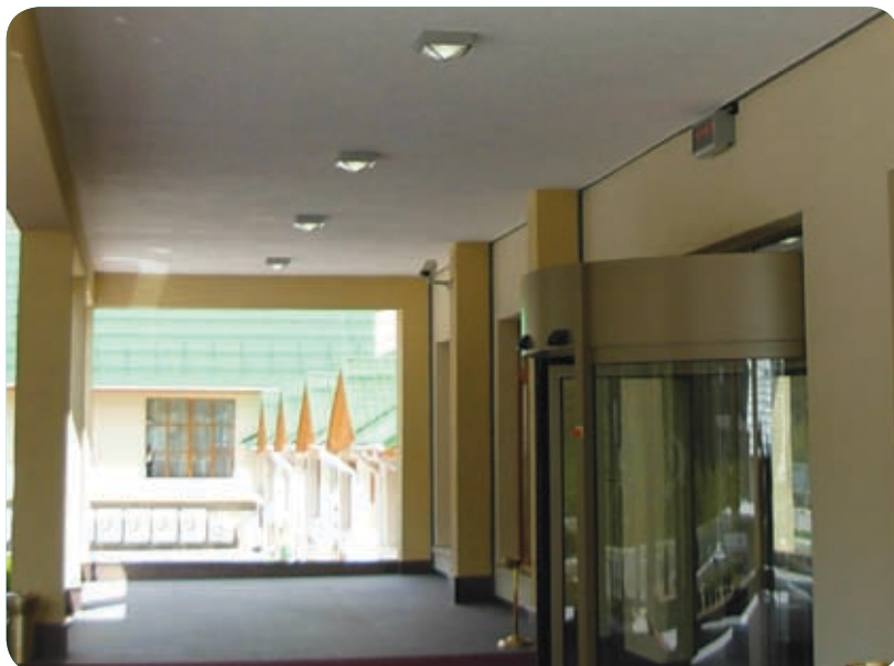
Гранд Отель Поляна (Красная Поляна)