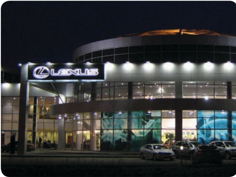
Автосалон «Лексус-Левобережный» (Москва)