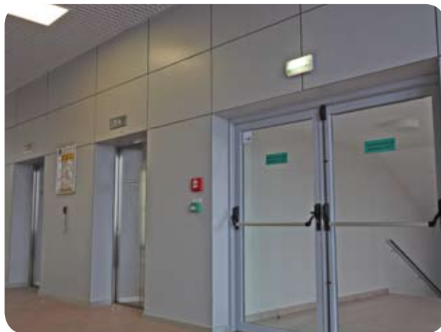
Аэровокзал аэропорта «Шереметьево» (Москва)