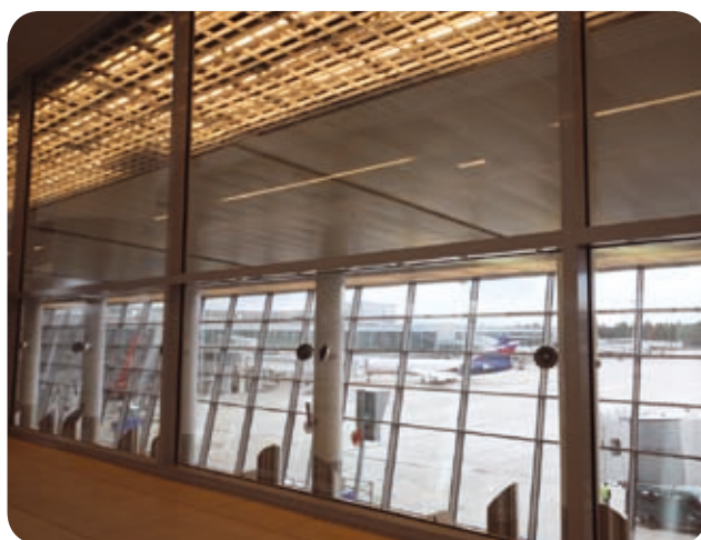
Терминал аэропорта «Шереметьево-3» (Москва)

Цельнометаллический корпус из листовой стали, покрытый белой порошковой краской, с торцевыми крышками из полимерного материала. В корпусе установлена пускорегулирующая аппаратура. Отражатели к светильнику заказываются отдельно.