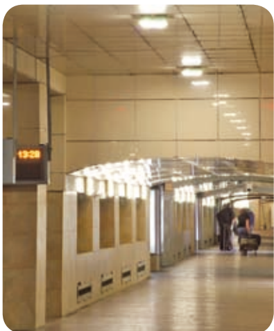
Курский вокзал (Москва)