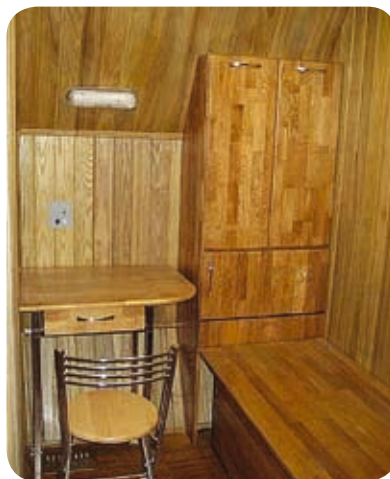
Интерьер экспериментального комплекса «Марс-500» (Москва)