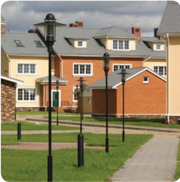
Клубная резиденция «Ангелово» (Московская обл.)