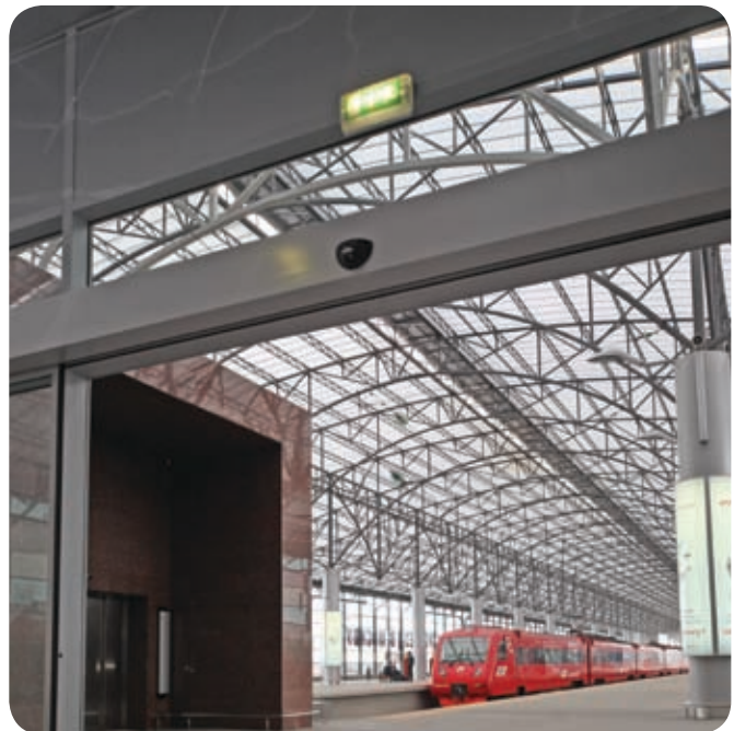
Аэровокзал аэропорта «Шереметьево» (Москва)

Рассеиватель светильника изготовлен из прозрачного поликарбоната. Дополнительно к светильникам предлагаются пиктограммы (см. стр. 284).