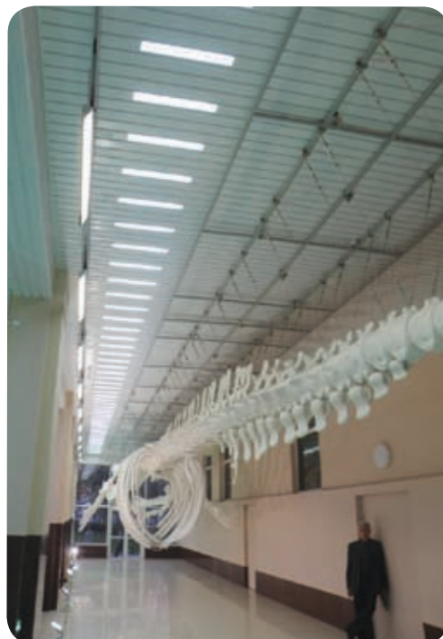
Краеведческий музей (Хабаровск)