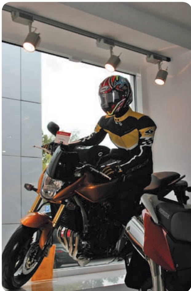
Техцентр Honda «Аояма Моторс» (Москва)