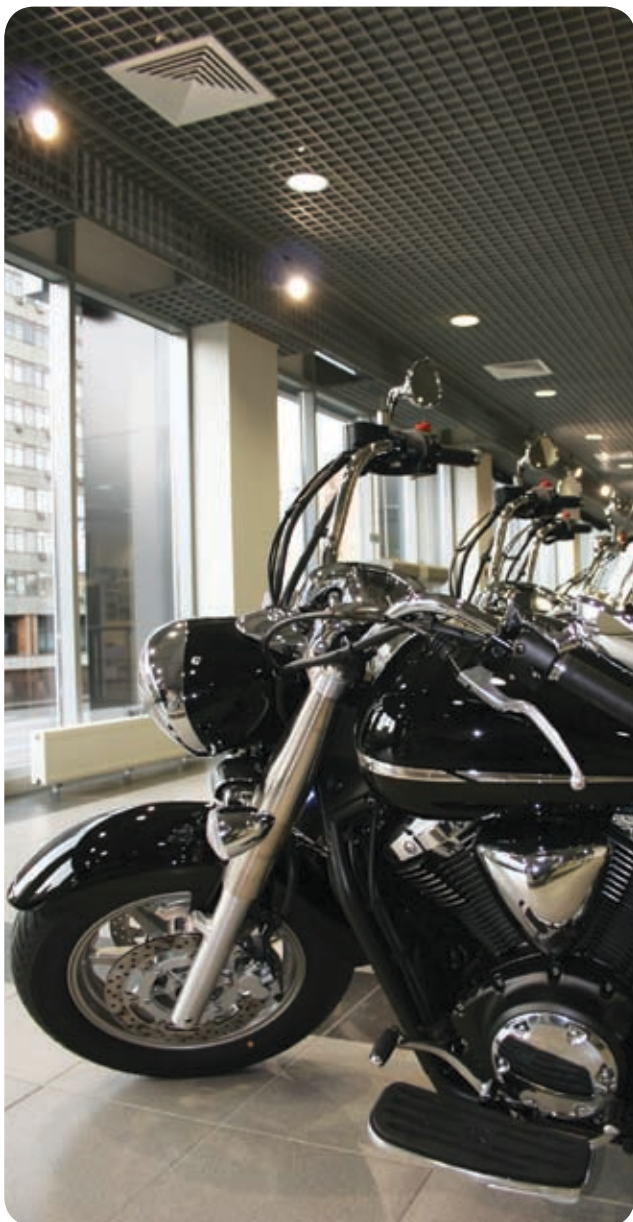
Yamaha Мотор Центр Сущевский (Москва)