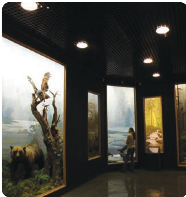
Краеведческий музей (Хабаровск)

Зеркальный отражатель из анодированного алюминия и силикатное стекло (виды стекол см. на стр. 115). Стекла заказываются отдельно.