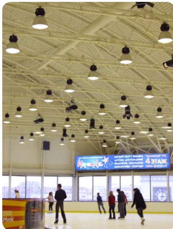
ТЦ «Европейский» (Москва)