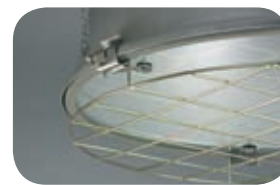
Светильник со стеклом и защитной решеткой. Код заказа решетки — 90102.