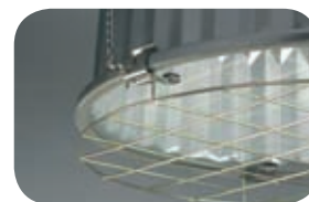
Светильник со стеклом и защитной решеткой. Код заказа решетки — 90103.