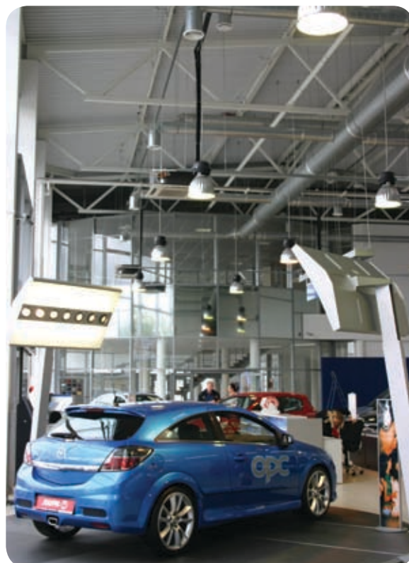
Автосалон Opel (Санкт-Петербург)

Анодированный алюминиевый фасетчатый отражатель может комплектоваться термостойким стеклом. Стекло крепится специальными клипсами. Масса стекла — 2,4 кг.