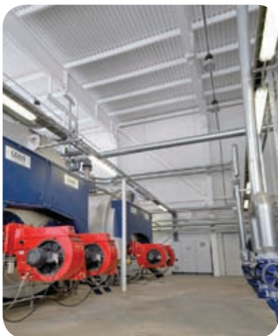
ЗАО «Московская Пивоваренная Компания» (Мытищи)