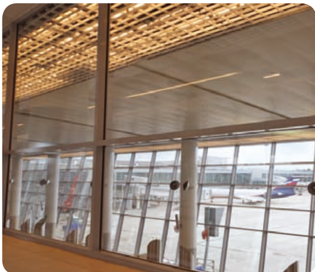
Терминал аэропорта «Шереметьево-3» (Москва)