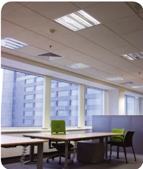
Офис компании British Petroleum (Москва)