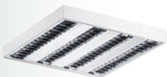
Светильник с зеркальными перфорированными вставками.