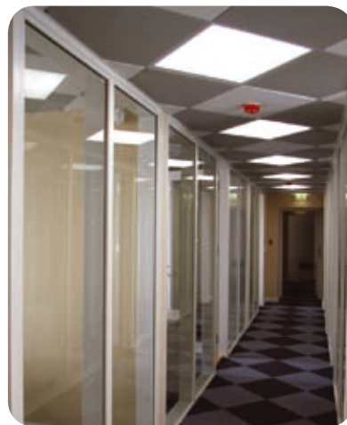
МВД Эстонии (Таллин)