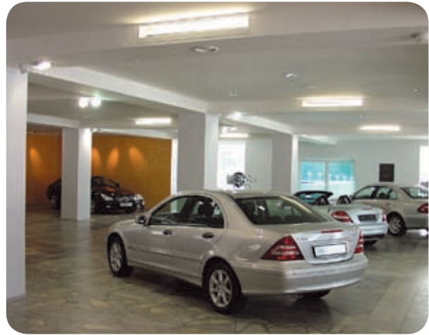
Автосалон «Mercedes» (Екатеринбург)