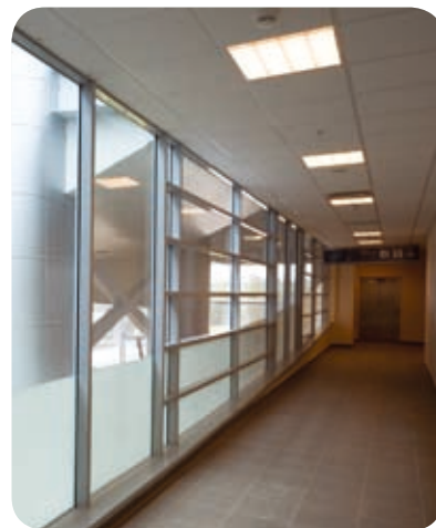
Терминал аэропорта «Шереметьево-3» (Москва)