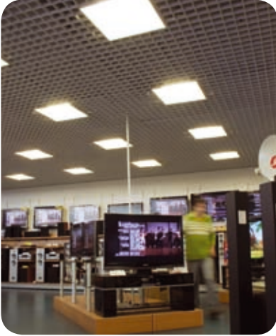
Магазин розничной сети «М.ВИДЕО» (Москва)