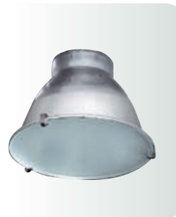
*Защитный алюминиевый отражатель для модификаций с МГЛ.