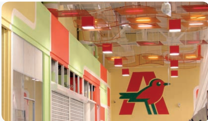
Гипермаркет «Ашан» (Москва)