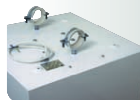
Вид светильника с тыльной стороны.

Номинальные рабочие токи ламп МГЛ указаны на стр. 301